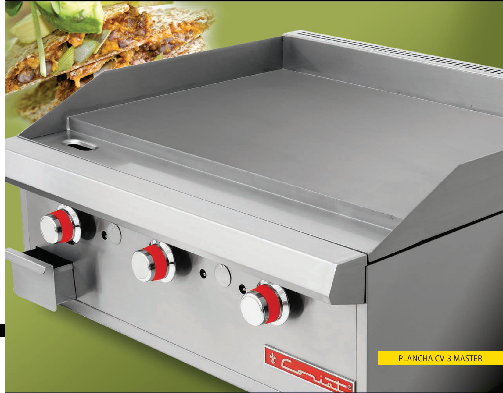
PLANCHA CV-3 MASTER